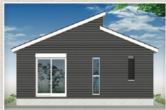
4号棟 完成予想イメージ