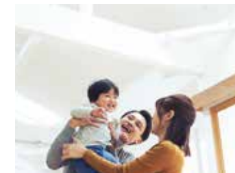
3 開放的なリビング空間 リビングは勾配天井の開放的な空間。庭に面した大開口の窓から明るい陽射しも差し込みます。