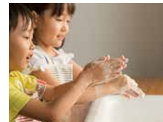
2 衛生的な生活動線 帰宅後すぐに「手洗い・うがい」ができる動線でウイルスを洗い流せます。