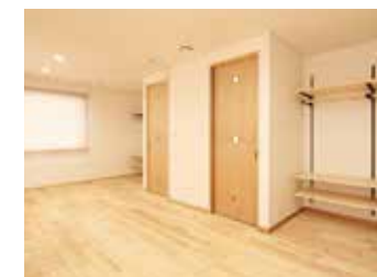
5 2ドア1ルームの洋室 お子様の成長やご家族構成に合わせて、2部屋に間仕切りすることが可能です。