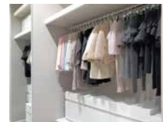
4 大容量のウォークインクローゼット 主寝室に大容量のウォークインクローゼット。季節物の衣類をまとめて収納できて便利です。