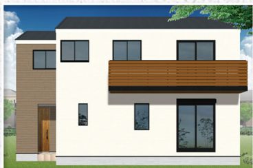
2号棟(南面) 完成予想イメージ