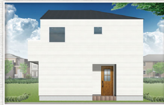
完成予想立面 CG パース / 3号棟東面