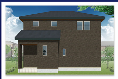
11号棟(北面) 完成予想イメージ