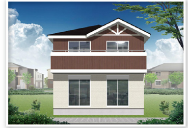
14号棟 / 南面

2ドアワンルーム 主寝室と洋室をひとつの広い空間に。お子様が幼いうちは共に寝起きし、お子様の成長に合わせて個室を与えられるプランです。(壁の設置には別途有償工事が必要となります。)